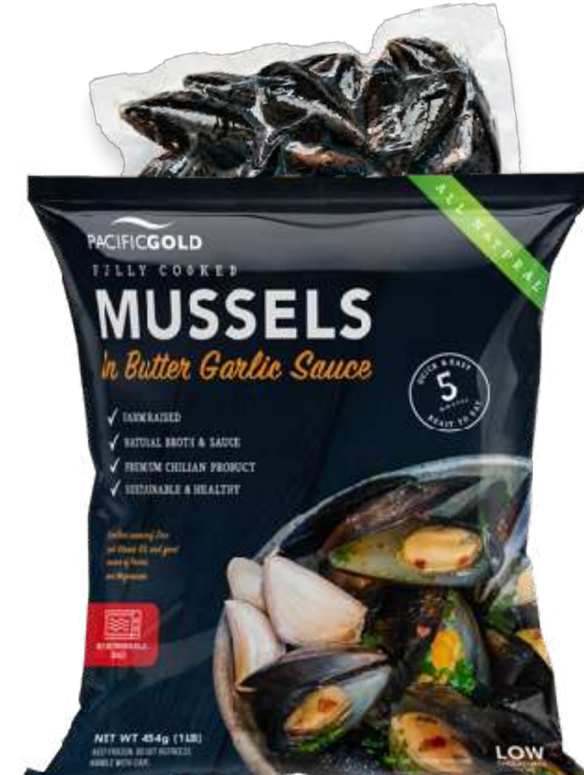
全壳熟制贻贝 黄油蒜蓉酱