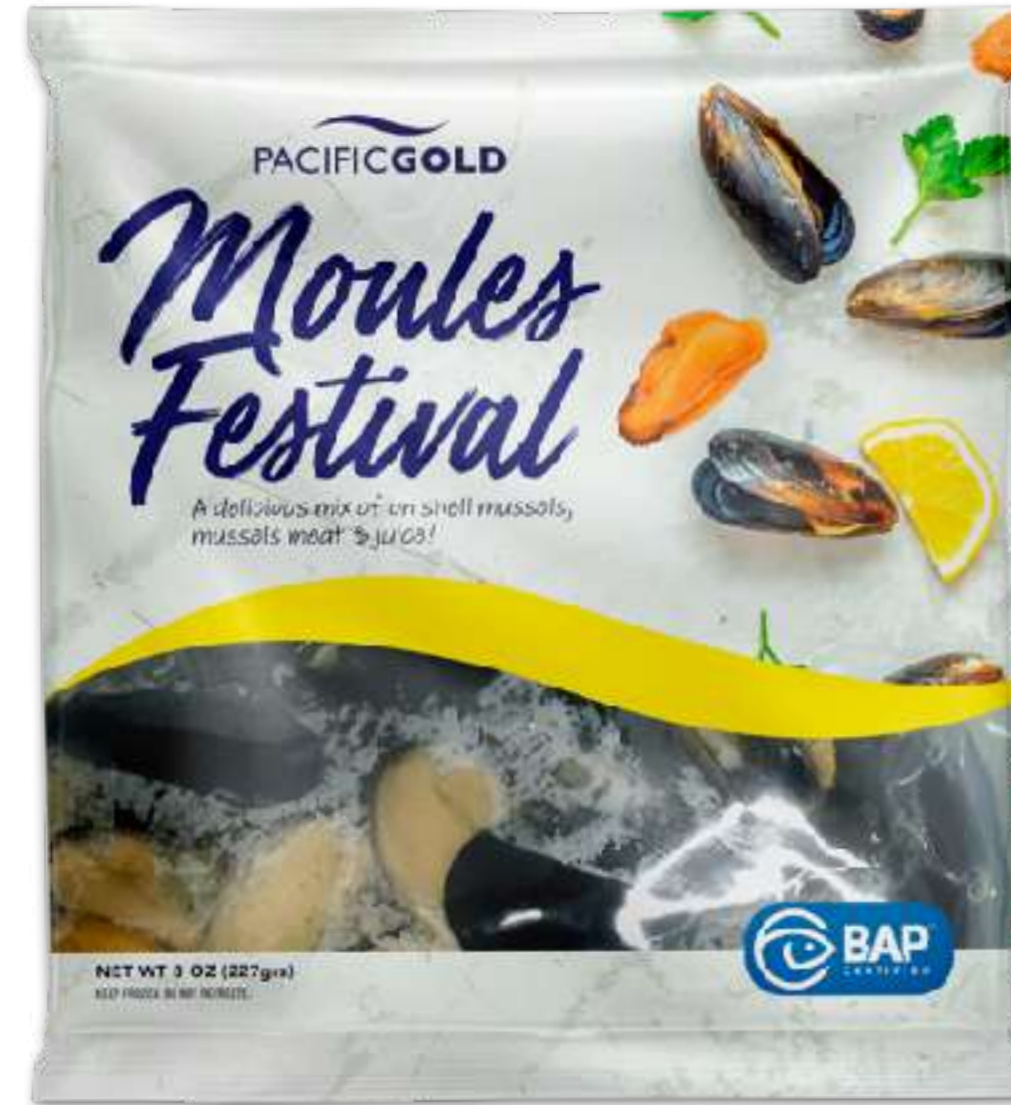
贻贝盛会 (Moules Festival)