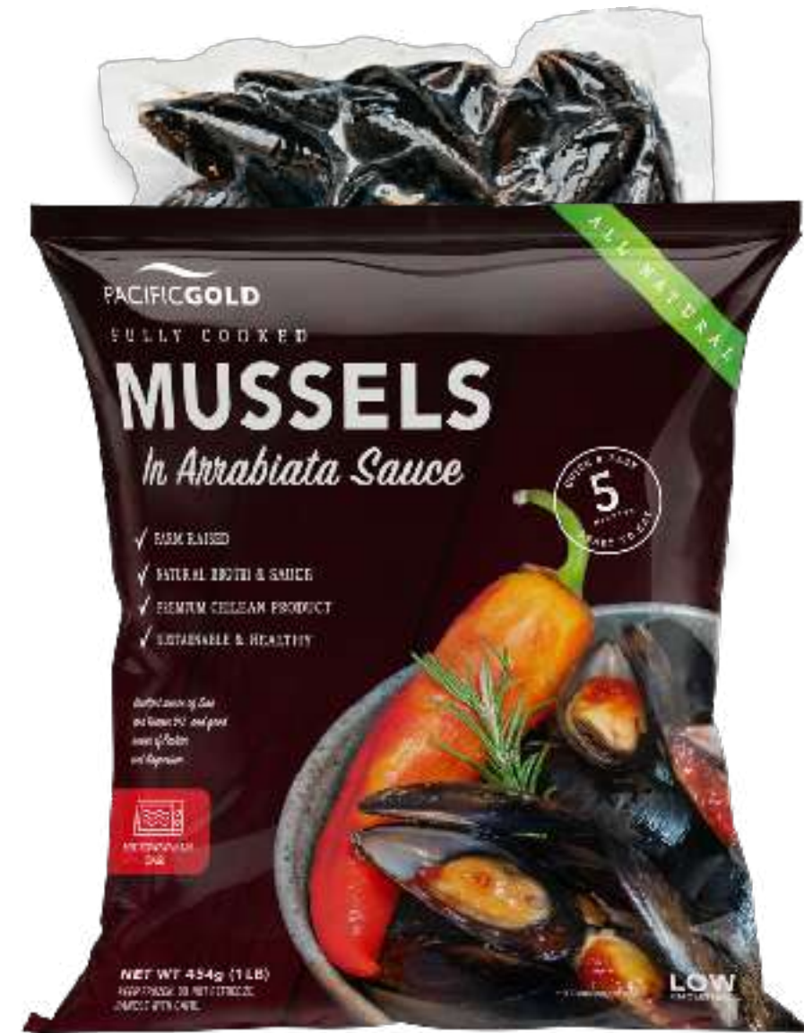
全壳香辣茄酱贻贝