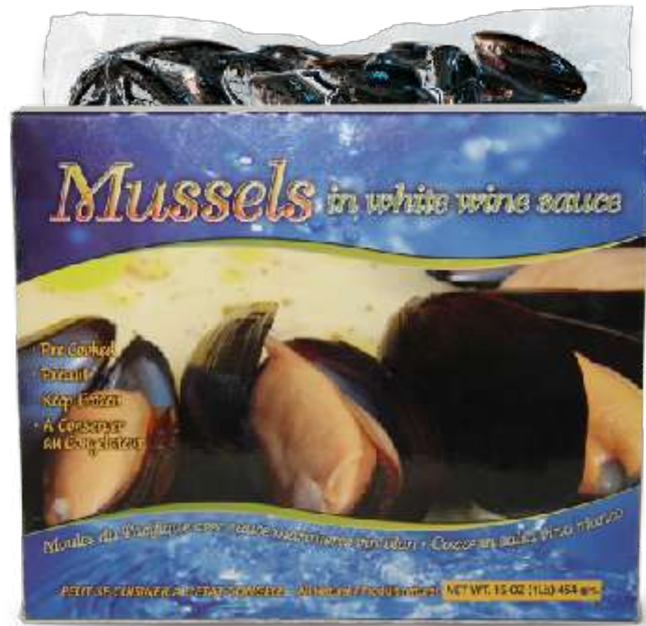
全壳白葡萄酒烩贻贝