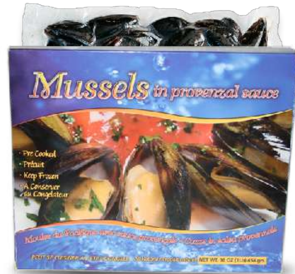
全壳普罗旺斯酱贻贝