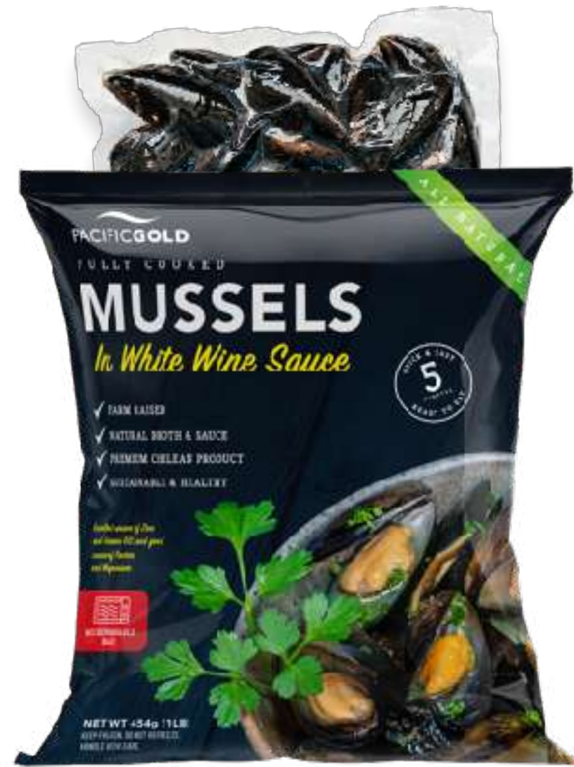
全壳熟制贻贝 白葡萄酒烩