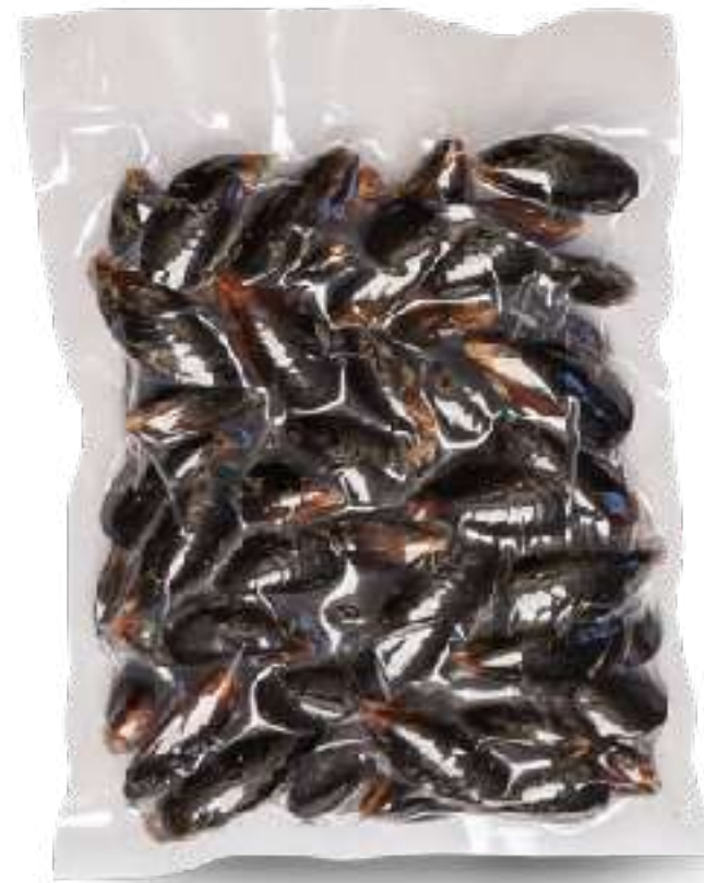
全壳贻贝/无字袋装