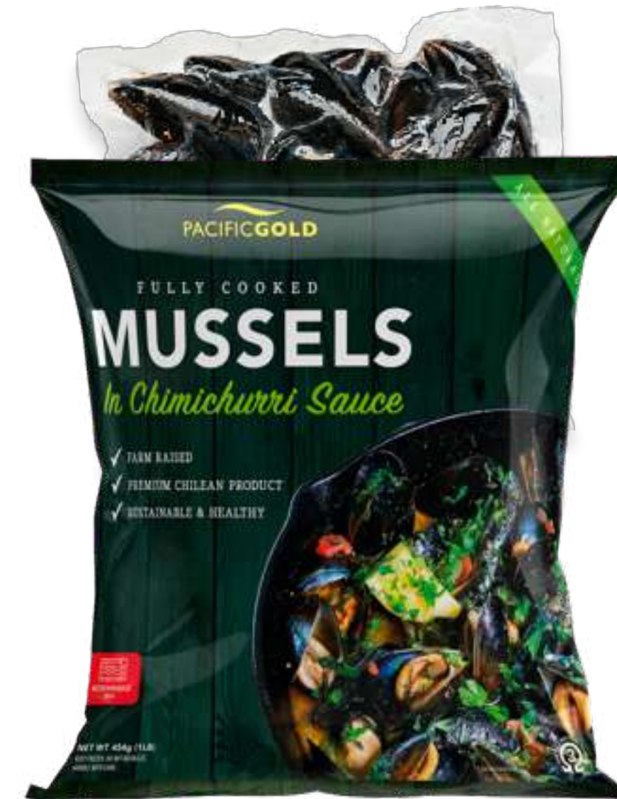
全壳阿根廷青酱贻贝