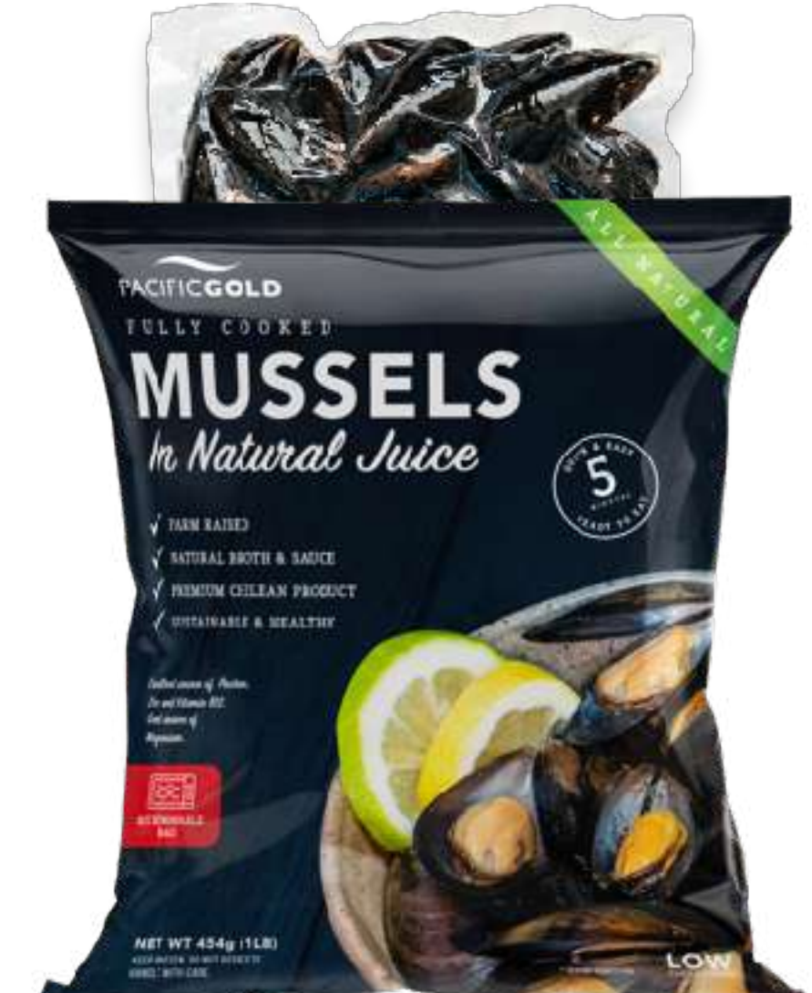
全壳熟制贻贝 原汁