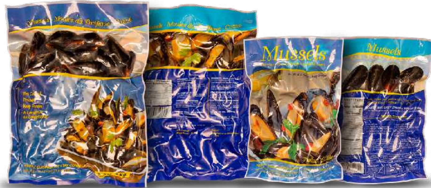
全壳贻贝/印字袋装