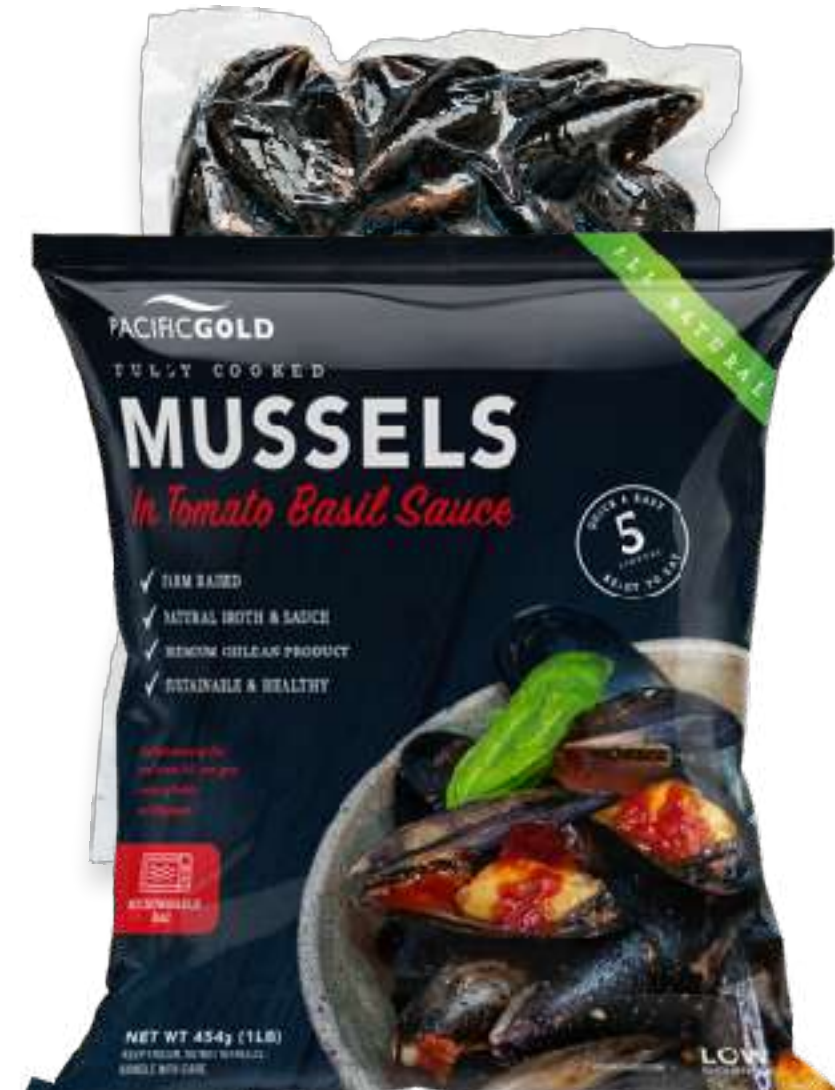
全壳熟制贻贝 番茄罗勒酱