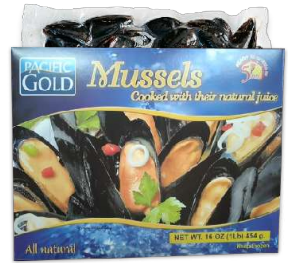
全壳熟制原汁贻贝