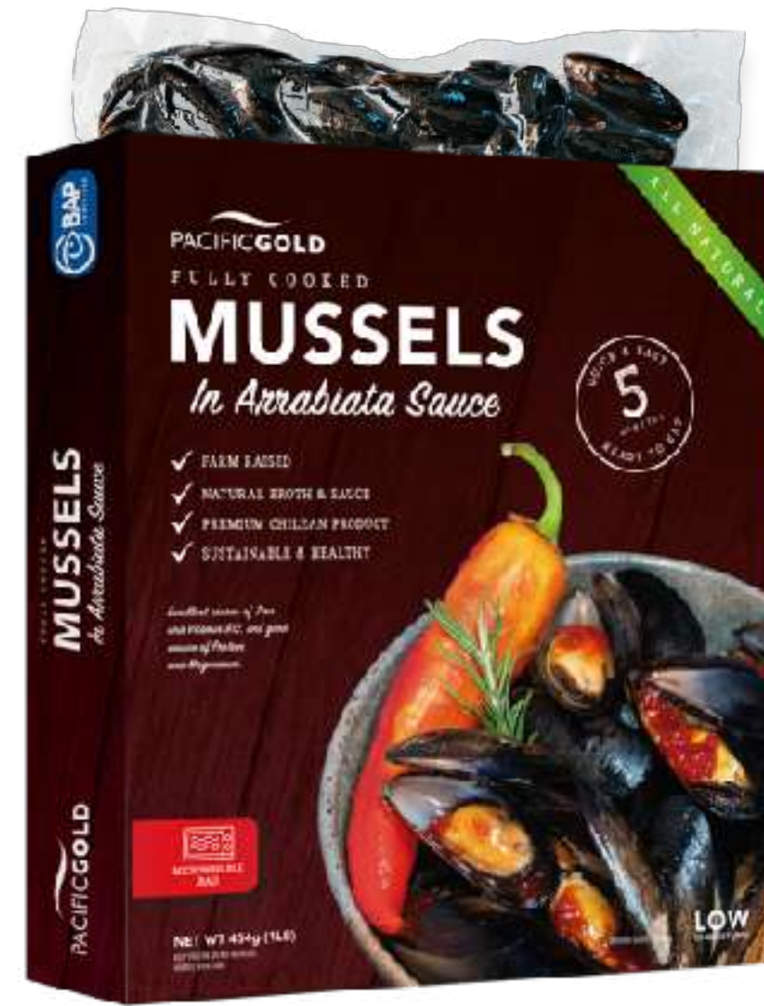
全壳香辣茄酱贻贝