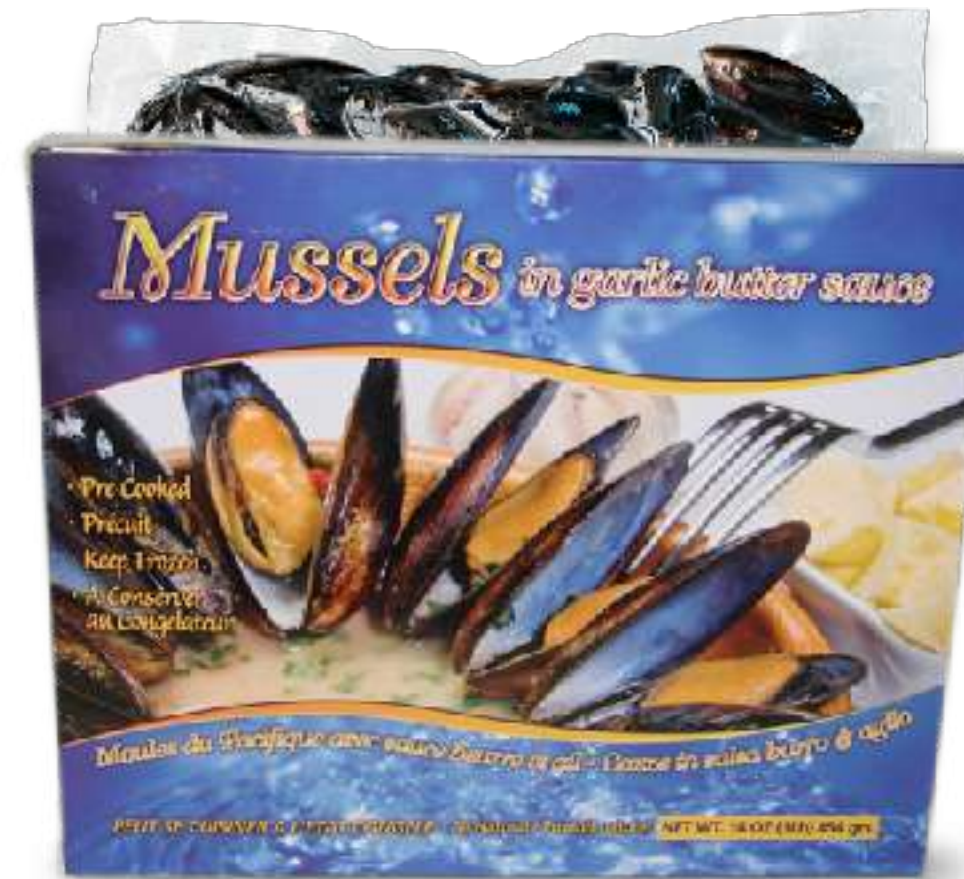
全壳黄油蒜蓉酱贻贝